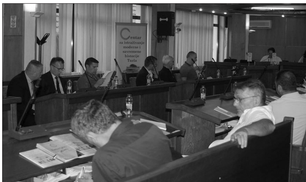
Prilog 3. Učesnici Međunarodne naučne konferencije, Brčko, 13. i 14. septembar 2019. godine.

Međunarodna naučna konferencija, po ozbiljnosti i širini postavljanja problema doseljavanja i iseljavanja sa ovih prostora, predstavlja dosada najvažniji intelektualni poduhvat ove sredine od osnivanja Brčko Distrikta Bosne i Hercegovine. Zadatak koji je organizator sebi postavio bio je da, koristeći savremene metodologije oslobođene ideološkog imperativa koja je pratila prethodni pokušaj, sistematizuje dosadašnja znanja o prošlosti Brčkog i uzevši migracije kao polazišni orijentir pođe korak dalje u odnosu na zasada jednu jedinu ozbiljniju publikaciju o prošlosti ovog grada Brčko i okolina u radničkom pokretu i NOB-u . Migracije nisu slučajno izabrane da budu polazna tačka za novo preispitivanje historijskih tokova ove sredine, jer one su imale ne značajan, već odlučujući uticaj na cjelokupni razvoj ovih krajeva.