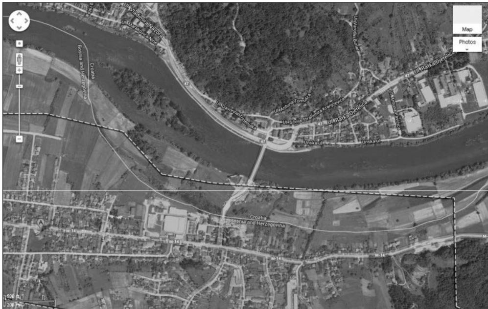
Prilog 3. Granica na rijeci Uni između dvije Kostajnice riješana je temeljem „avnojevske“, dakle austro-ugarske.