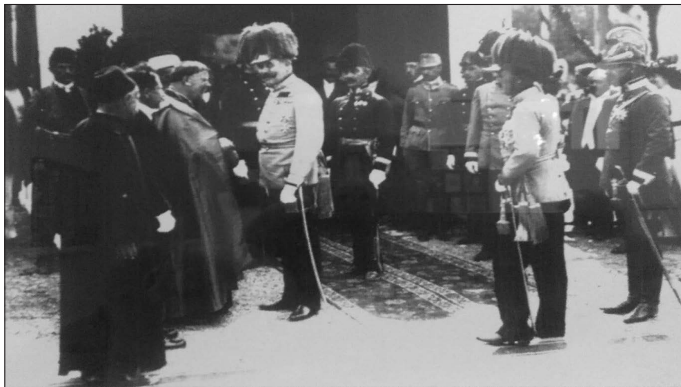
Prilog 1. Doček Franca Ferdinanda u Mostaru 25. juna 1914. godine (u kaftanu gradonačelnik Mujaga Komadina).

Dana 25. juna 1914. godine, Franc Ferdinand je iz Metkovića stigao u Mostar. 18 Na željezničkoj stanici dočekao ga je svečani prijem, a izraze dobrodošlice prijestolonasljedniku uputio je gradonačelnik Mostara Mujaga Komadina. Nakon što se kratko zadržao u Mostaru, održao kraći govor i obišao važnije institucije, Franc Ferdinand je otputovao za Sarajevo.