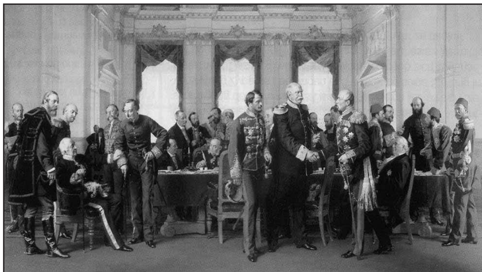
Prilog 1. Berlinski Kongres, 13. juli 1878. godine.

Sandžaka, koji se prostire između Srbije i Crne Gore u jugoistočnom pravcu do iza Mitrovice, te će u njemu i dalje ostati Osmanlijska uprava. Pa ipak, da bi se osiguralo novo političko stanje, kao i sloboda i bezbjednost saobraćajnica, Austro-Ugarska zadržava pravo da na cijelom ovom prostoru od starog Vilajeta Bosne drži garnizone i da u svojoj vlasti ima njegove vojničke i saobraćajne puteve. U tom cilju Vlade Austro-Ugarske i Osmanlijske Imperije zadržavaju pravo da dođu do sporazumjevanja o detaljima.