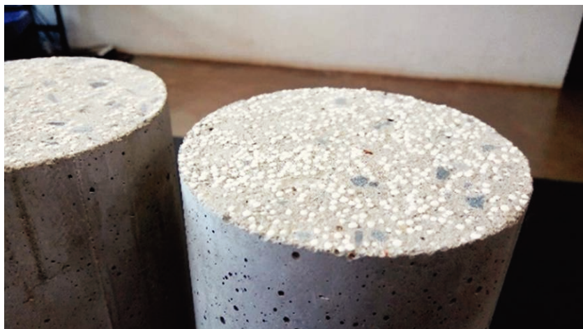
Figura 1. Superfície de um corpo de prova de concreto leve com EPS

O EPS pode ser utilizado na construção de civil de diversas formas, incluindo: enchimento de laje e fôrmas para concreto; uso em lajes industrializadas e nervuradas em edifícios; isolamento térmico de telhados, dutos de ar-condicionado, tubulações, reservatórios e câmaras frigoríficas (ABRAPEX, 2017a); produção de concreto leve (Figura 1); fabricação de painéis monolíticos, autoportantes e divisórios (ABIQUIM, 2017); fabricação de forros isolantes e decorativos; isolamento acústico em piso flutuante; drenagem; juntas de dilatação; fundação para estradas, etc. (ABRAPEX, 2017a). Dentre as aplicações mais recentes do EPS no setor da construção civil e geotecnia, citam-se ainda o sistema Wall System , o Geofoam e os chamados pisos radiantes (ABIQUIM, 2017).