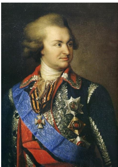
Рис. 1. Князь Г.А. Потемкин-Таврический (1739–1791 гг.)

Большой проблемой для крымского виноделия было приглашение в 1792 г. русским правительством туземных христиан для колонизации только что учрежденной Екатеринославской губернии. Греки и армяне, составлявшие ядро виноградовладельцев, переселились туда и вследствие этого множество деревень в горной полосе Крыма опустели, а сады подверглись одичанию. Князь Потемкин (Рис. 1), сельскохозяйственные начинания, которого в южном крае заслуживали полной благодарности, обратил особенное внимание на развитие виноделия в недавно приобретенном крае. Немедленно он, с разрешения императора Иосифа II, поручил токайскому виноградарю-собственнику Бимболазарю, заготовить токайские лозы, привезти с собой опытных виноградарей. В 1785 г. Бимболазарь привез уже собой 4 виноградарей и 20 тыс. виноградных токайских лоз. Примерно в это же время князем Потемкиным был выписан некий иностранец Банке, для разведения в Судаке виноградников и вообще для улучшения способа обработки виноградников и производства вина.