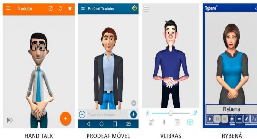
Foto 5 – Aplicativos de tradução português-Libras disponíveis para dispositivos móveis.

Destacamos, ademais, o Hand Talk 6 , o ProDeaf 7 e o Rybená 8 . O Hand Talk realiza a tradução digital e automática para a Língua de Sinais, utilizando um intérprete virtual 3D. O ProDeaf e o Rybená traduzem texto e voz de português para Libras e, além de traduzir, permitem criar e compartilhar sinais em Libras, dentre outros.