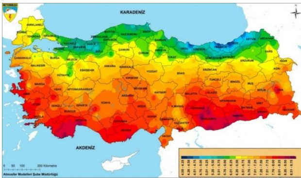
Şekil 2. Türkiye'nin güneşlenme süre haritası.

Güneşlenme Süresi: Yüzeye düşen direkt radyasyonun 1395 W/m^2 ’den yüksek olan alanların süresini ifade etmektedir [15]. Enerji verimi hesaplamasında %100 etkili bir parametredir. Şekil 2’de Türkiye’nin güneşlenme süre değerleri görülmektedir.