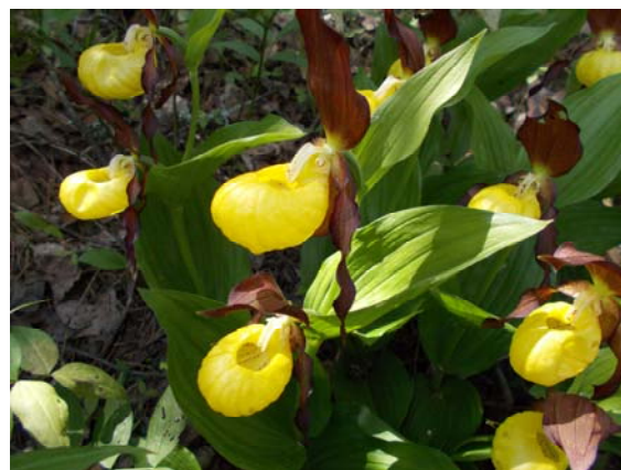
Рис. 1. Растения Cypripedium calceolus в обнаруженном местонахождении