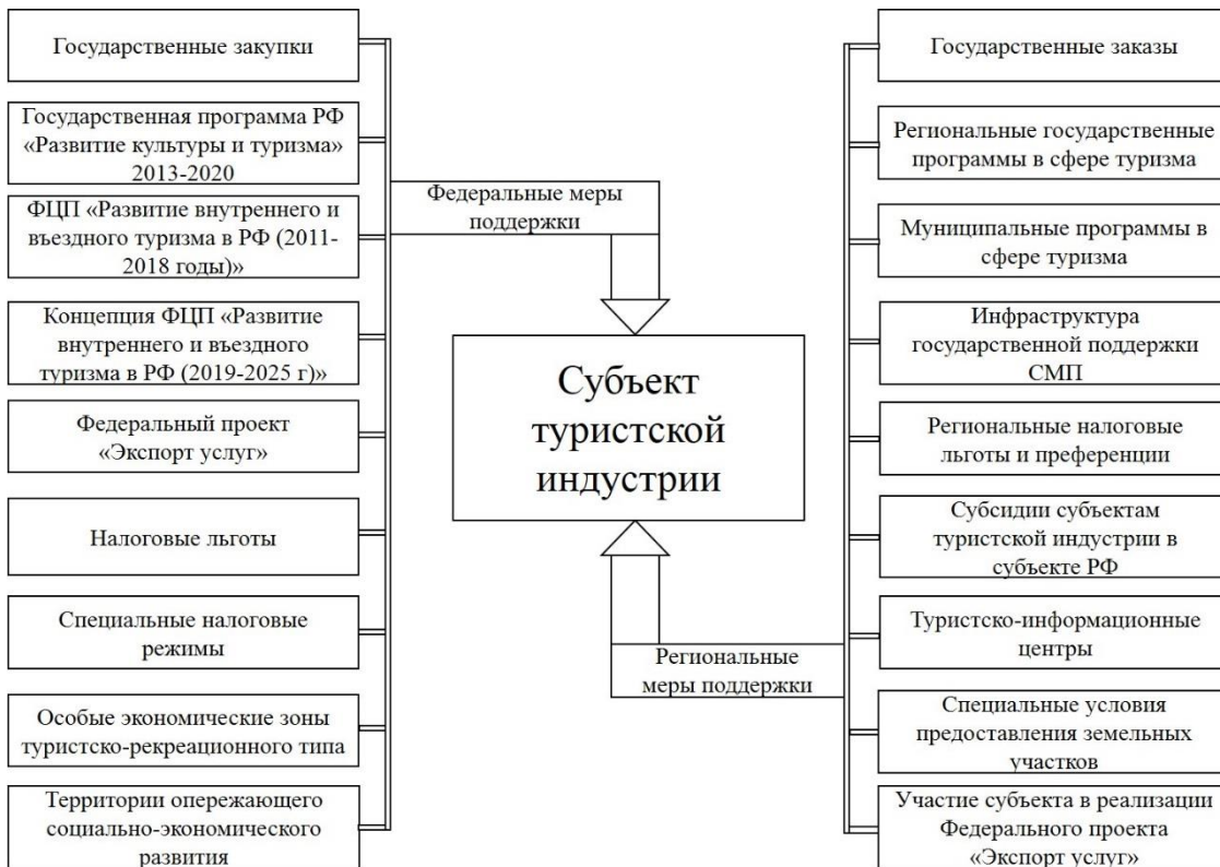
Рис. 1. Структура мер государственной поддержки субъектов туристской деятельности на региональном уровне

По мнению автора, в обобщенном виде региональные меры государственной поддержки сферы туризма можно объединить в три основных блока.