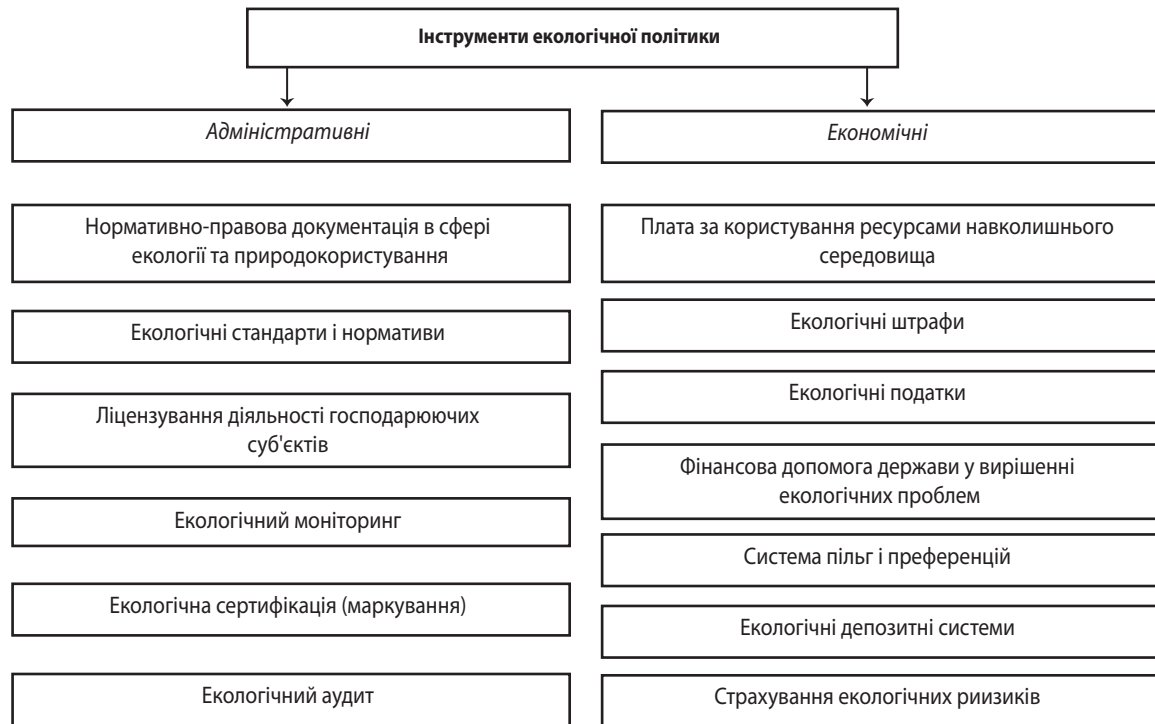
Рис. 2. Інструменти екологічної політики

ристання фінансових та інших ресурсів здатне привести до миттєвого поліпшення екологічної обстановки, повернення початкових умов екосистеми.