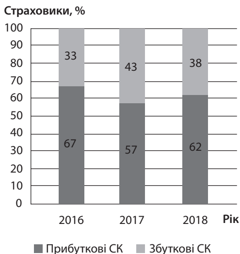
Рис. 1. Відсотковий розподіл страхових компаній України за ознакою чистого фінансового результату у 2016–2018 рр., %

Примітка: вісь x – рік; вісь y – відсоток страховиків.