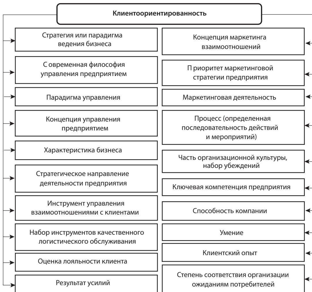
Рис. 2. Систематизация научных подходов к формулированию термина «клиентоориентированность»