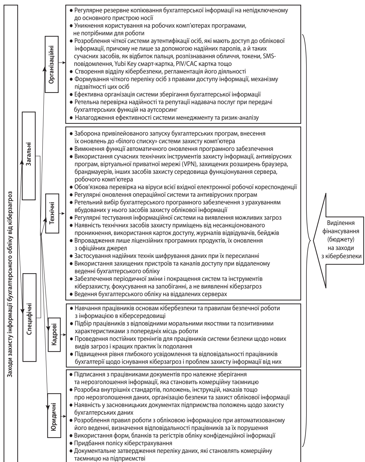
Рис. 3. Комплексна система заходів гарантування кібербезпеки бухгалтерської інформації на підприємстві