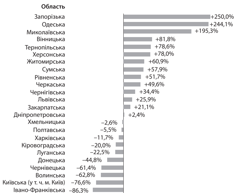
Рис. 2. Темпи зростання зареєстрованих кіберзлочинів в Україні (у розрізі областей) у 2018 р. порівняно з 2017 р.