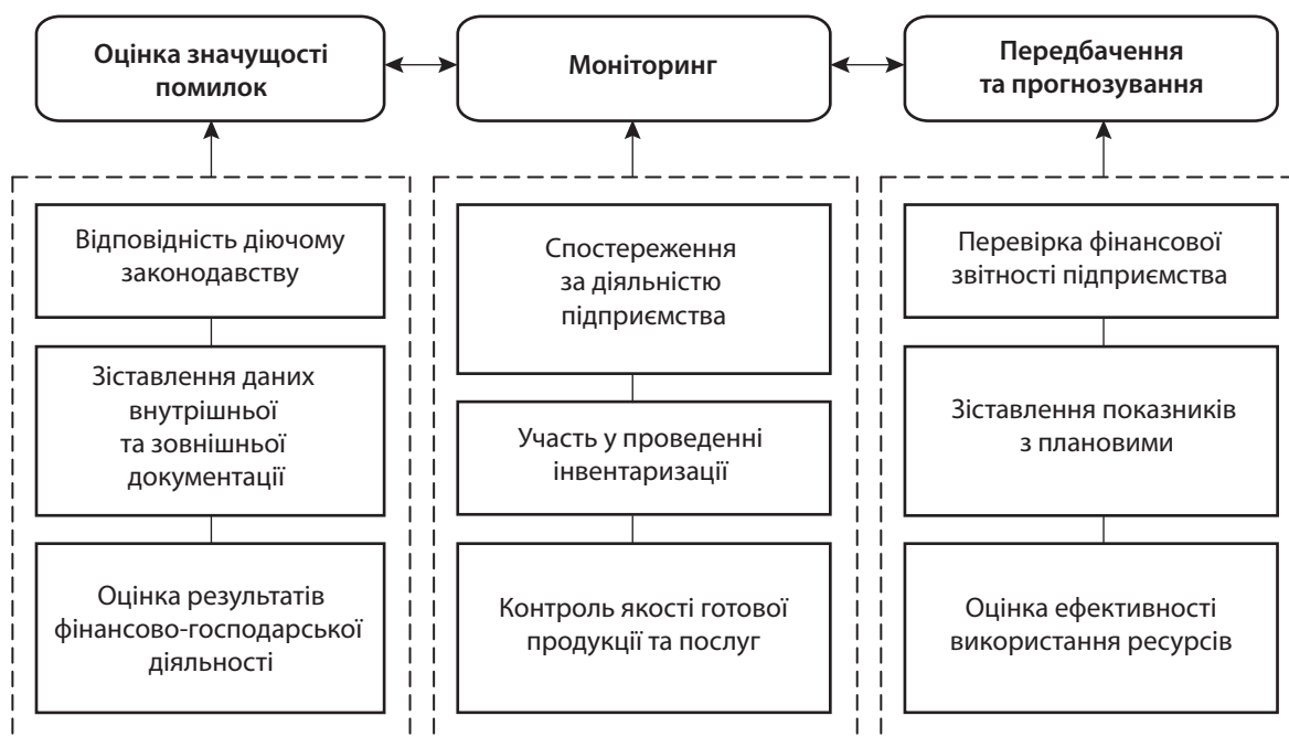
Рис. 2. Функціональні параметри організації автоматизованої системи внутрішнього контролю

Автоматизований внутрішній контроль діяльності підприємства полягає в послідовній реалізації його функцій. Так, на підставі інформації, отриманої