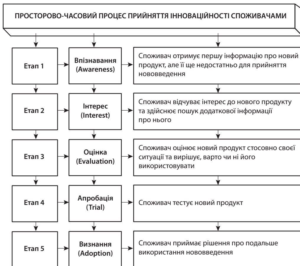
Рис. 2. Просторово-часовий процес прийняття інноваційності споживачами