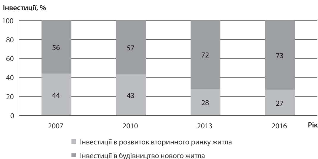
Рис. 2. Капітальні інвестиції населення відповідно до капіталу, вкладеного в нове житло, та розвиток вторинного ринку житла в Європі (EU 28), 2007 р. до 2016 р., %

Враховуючи непогашені позики на десяти іпотечних ринках країн ЄС (Бельгія, Данія, Франція, Німеччина, Ірландія, Нідерланди, Португалія, Іспанія, Швеція та Великобританія), ринки іпотечних кредитів значно збільшилися за останнє десятиліття в більшості цих економік. За оцінками зарубіжних аналітиків, у 2017 р. непогашене кредитування за поточними цінами помітно перевищувало рівні 2007 р. у Бельгії (+32,0%), Німеччині (+73,3%), Данії (+18,8%), Франції (+40,6%), Нідерландах (+14,4%), Швеції (+89,2%) та Великобританії (+20,7%). З іншого боку, обсяги іпотечного кредитування суттєво скоротилися в Португалії (–6%) та Іспанії (–12,7%), та Ірландії (–40,6%) [23]. За показником валового житлового кредитування диференціація тенденцій у різних країнах була більш чітко вираженою. У 2017 р. обсяг виданих іпотечних кредитів та зовнішніх перестраховувань значно перевищив рівні до фінансової кризи в Бельгії (+60,7%), Франції (+86,6%, внаслідок дуже динамічного перестраховування в останніх кварталах), Швеції