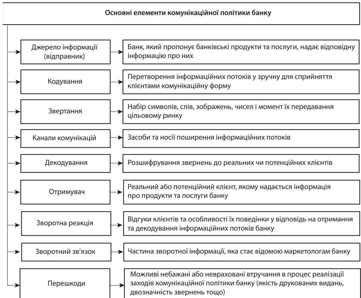
Рис. 2. Основні елементи комунікаційної політики банку [8]

ватися на поєднанні всіх засобів комунікацій з метою підвищення власної привабливості.