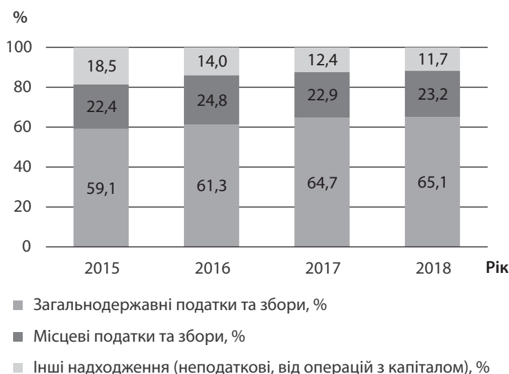
Рис. 1. Структура власних доходів місцевих бюджетів