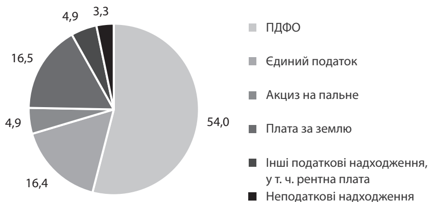
Рис. 3. Структура власних доходів середньостатистичної ОТГ Центрального регіону України, %

В ОТГ регіону із часткою місцевих податків понад 50% власних надходжень вагомим джерелом наповнення бюджетів була плата за землю (забезпечувала понад 30% власних надходжень ОТГ). Переважно це була орендна плата з юридичних осіб за користування землями державної та комунальної власності. У перспективі доходи таких ОТГ можуть зрости за умов: