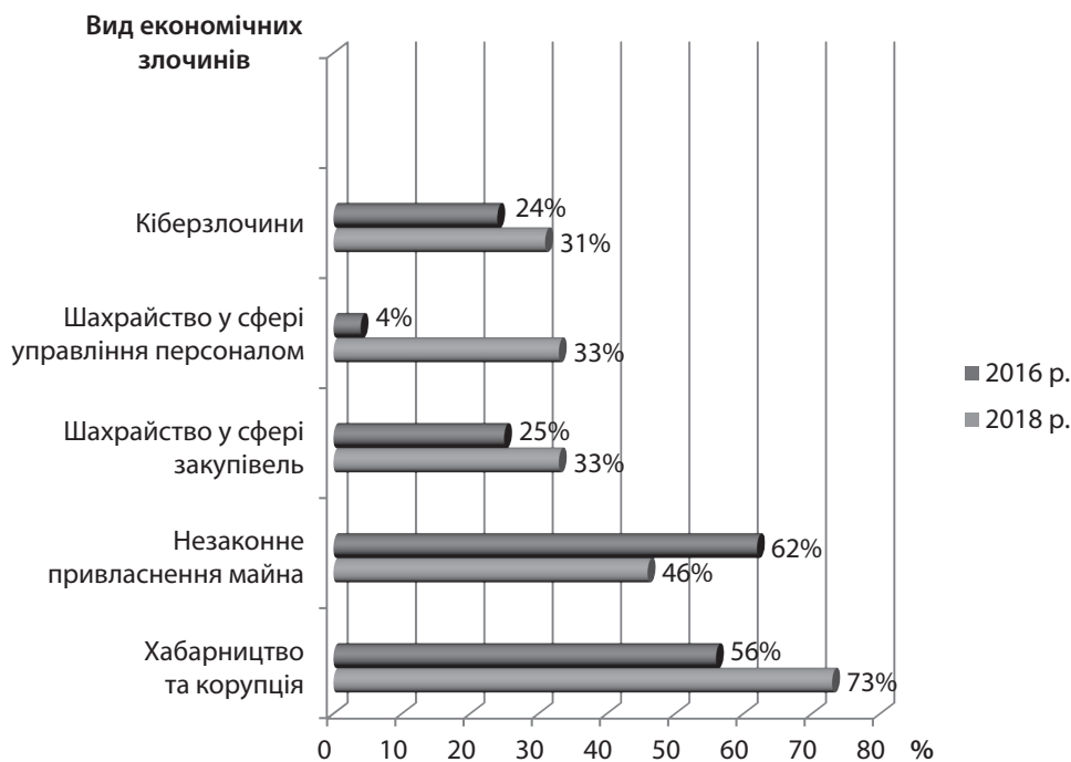
Рис. 1. Найпоширеніші види економічних злочинів у 2016–2018 рр.

цього оцінюється якість існуючих зв'язків, яке вони можуть створювати підґрунтя для виникнення шахрайства, а також готуються пропозиції з регулювання процесу обміну інформацією [12, с. 147]. Г. Стівенсон і Д. Крамблей під терміном «форензик» розуміють діяльність, спрямовану на виявлення, аналіз і врегулювання ситуацій, при наявності між сторонами розбіжностей з питань, що містять у собі значні економічні ризики [13]. Деякі зарубіжні автори вважають, що форензик – це сукупність незалежних ініціативних послуг, що надаються власникам або раді директорів компаніями різних організаційно-правових форм – аудиторськими, консалтинговими та іншими спеціалізованими компаніями [14]. С. С. Чернявський, О. Є. Користін, В. А. Некрасов наголошують, що форензик є послугою з виявлення та зменшення ризиків виникнення шахрайства, незаконних дій та неетичної поведінки у сфері господарської діяльності [15, с. 12]. О. І. Пацула зазначає, що основною метою даного виду діяльності є виявлення загроз шахрайства, збір доказів за фактом виявленого порушення і (або) встановлення винних осіб [16, с. 142].