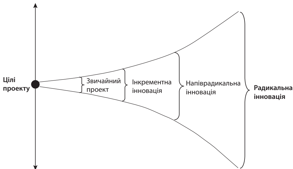
Рис. 3. Зв'язок між рівнем інноваційності та розкидом майбутніх результатів

ваційному проекту еволюціонувати для отримання найкращих результатів на виході, оскільки на кожному етапі реалізації ідеї існує висока ймовірність невідповідності отриманих результатів початковим цілям. Основна відмінність між різними проектами полягає у ступені їх інноваційності – проекти за цим показником значно різняться (рис. 3). Чим вищий рівень інноваційності проекту, тим більший розкид майбутніх результатів проекту, а отже, вищий рівень невизначеності та ризиків.