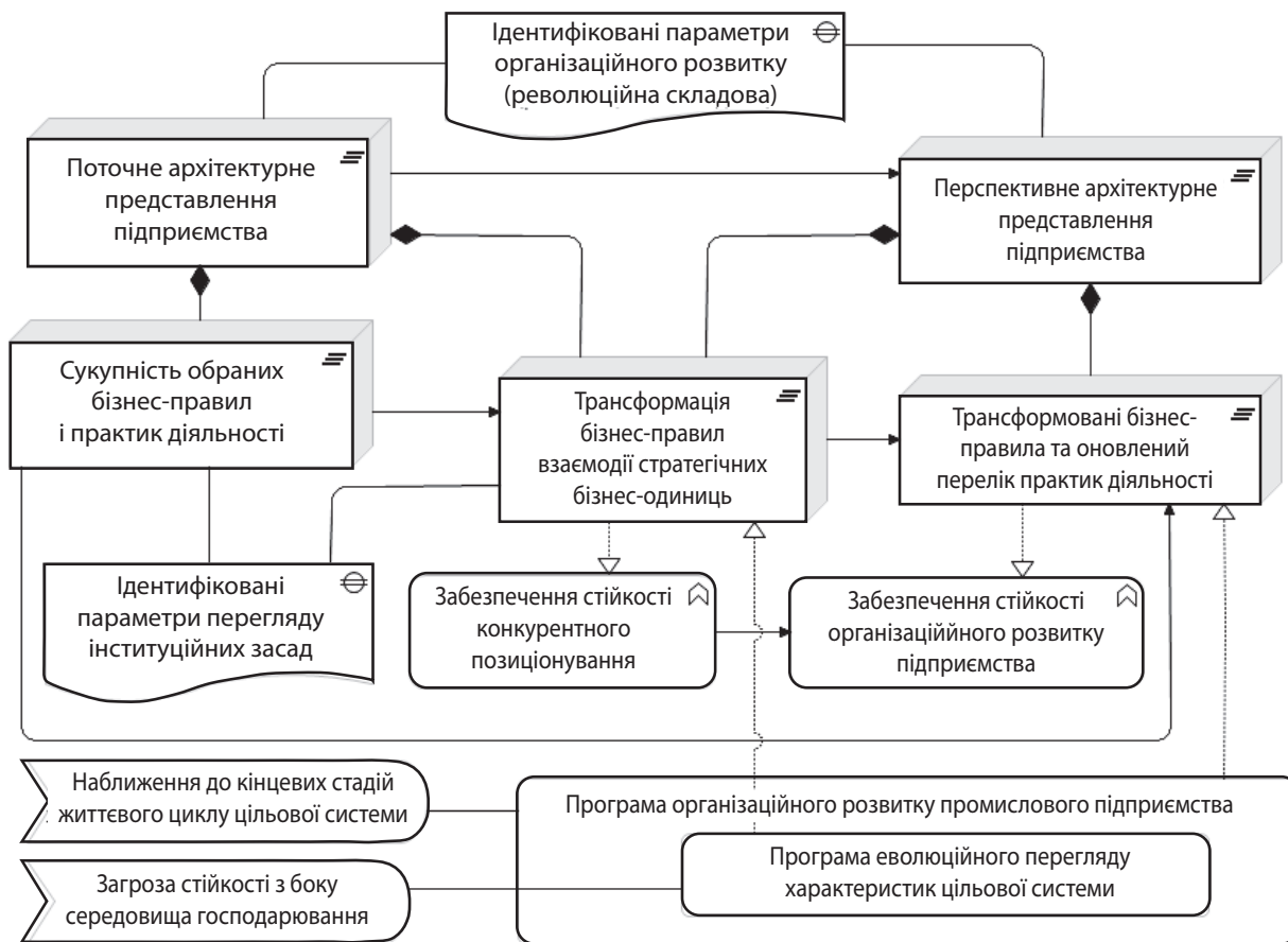
Рис. 3. Реалізація процесу управління організаційними змінами

безпеки стійкості функціонування та моделювання життєвого циклу підприємства. Методологічним підґрунтям дослідження постала мова архітектурного моделювання складних систем. На основі розгляду основних напрямків та сфер організаційного розвитку визначено орієнтири для їх удосконалення в рамках сформованих моделей предметної області та життєвого циклу підприємства. Перспективою подальшого розвитку є розширення наведених схем до модельного рівня.