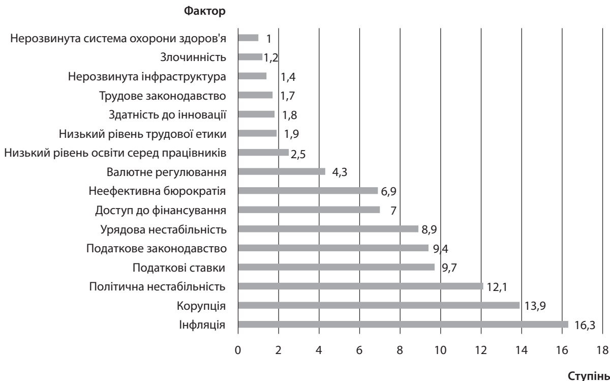
Рис. 5. Фактори, які перешкоджають веденню конкурентного бізнесу в Україні, за результатами опитування іноземних та вітчизняних респондентів

вати на умови її функціонування. З цього випливає, що високий рівень економічного розвитку, стабільна економіка та зростання економічних показників свідчать про те, що конкурентна політика держави зорієнтована на формування ефективних конкурентних відносин. У випадку ж криз і нестабільного розвитку економіки конкурентна політика держави повинна більше зосереджуватися на захисті добросовісної конкуренції, а не перешкоджати її розвитку прямим чи непрямим втручанням (рис. 5). У такому випадку вплив конкурентної політики на національну економіку – мінімальний.