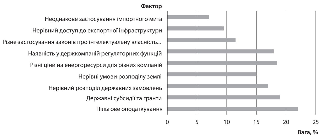
Рис. 1. Фактори нерівності в конкуренції за результатами опитування на вітчизняних підприємствах

Конкурентна політика України здійснюється завдяки комплексу інструментів: правила попередження, обмеження, а в деяких випадках навіть припинення недобросовісної діяльності конкурентів, правові норми захисту конкуренції та контролю за концентрацією підприємств у галузі та регулювання діяльності природних монополій. У законі України «Про Антимонопольний комітет України» (1993) визначено види монополій, їх межі, повноваження та завдання АМКУ у формуванні та реалізації конкурентної політики.