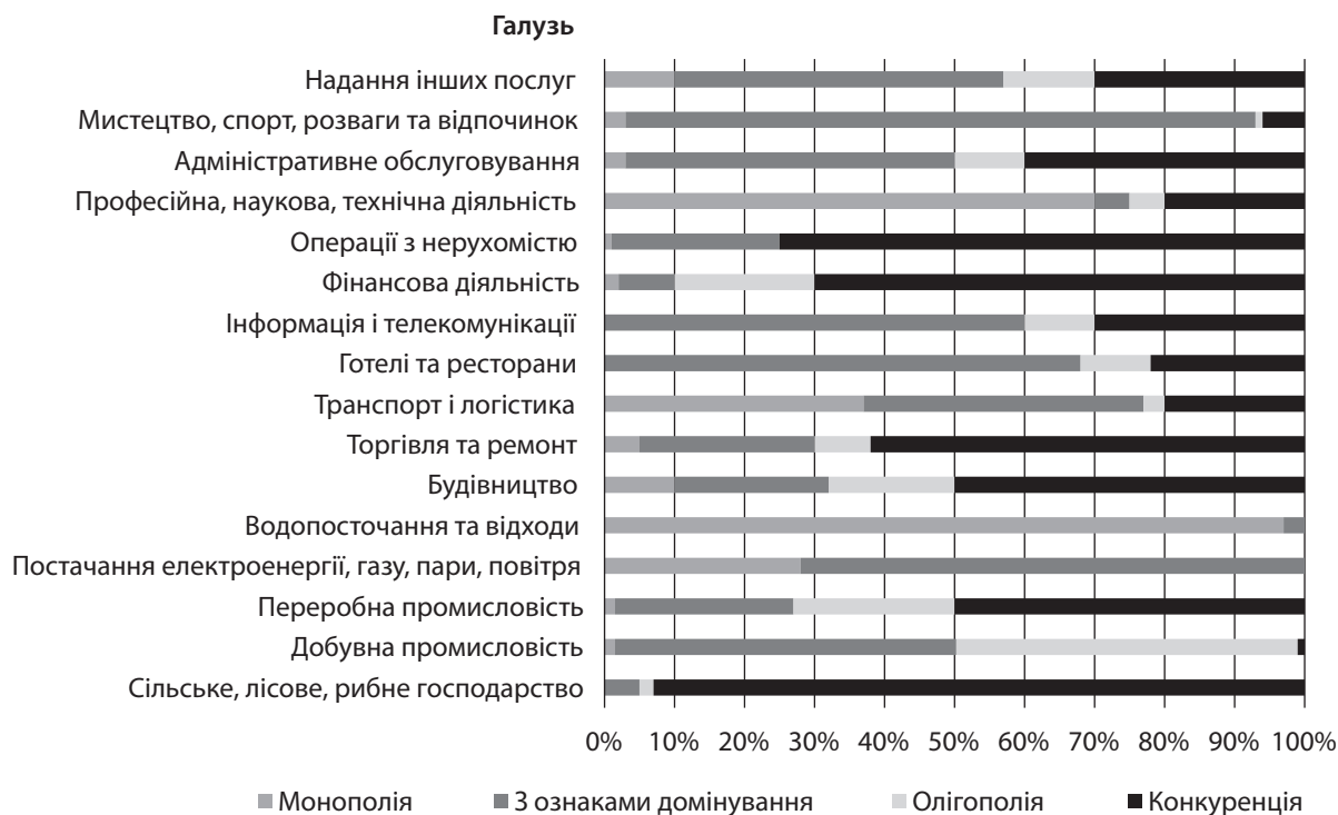
Рис. 3. Структура ринків основних галузей економіки України