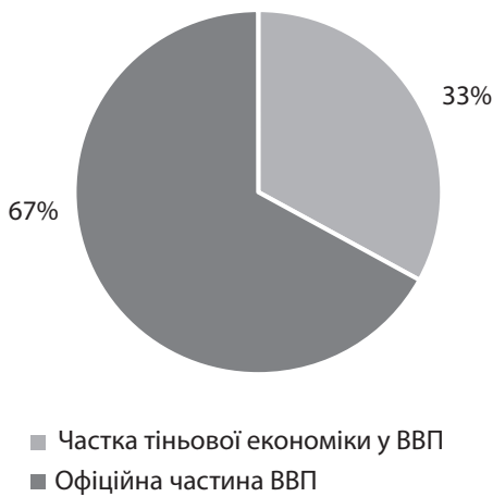
Рис. 4. Структура ВВП України, станом на початок 2017 р.