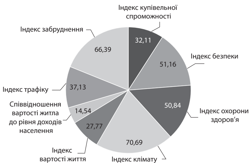
Рис. 2. Індекс якості життя в Україні, 2019 р.

Особливу увагу викликає стрімке підвищення значення показника у 2015–2016 рр. – з 22,29 до 90,67. Дану зміну можна пояснити підвищенням значень Індексу безпеки з 54,89 до 58,56; Індексу охорони здоров'я з 45,08 до 55,25 та зменшенням значення Індексу вартості життя – з 44,49 до 29,77. Це також пояснюється складною соціально-економічною ситуацією в країні у 2014–2015 рр. і погавленням макроекономічних показників економіки України у 2016 р. Так, наприклад, відбулося скорочення рівня інфляції до 12,4% порівняно з 43,3% у 2015 р., що стало можливим переважно завдяки стабілізації ситуації на валютному ринку та поміркованій монетарній політиці, а також спостерігалось підвищення реальних доходів населення за рахунок сповільнення зростання споживчих цін і відновлення економічного зростання до 4,8% [12].