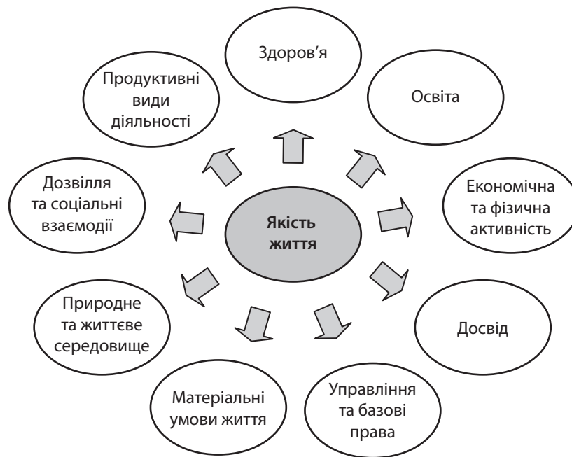
Рис. 1. Складові (виміри) якості життя