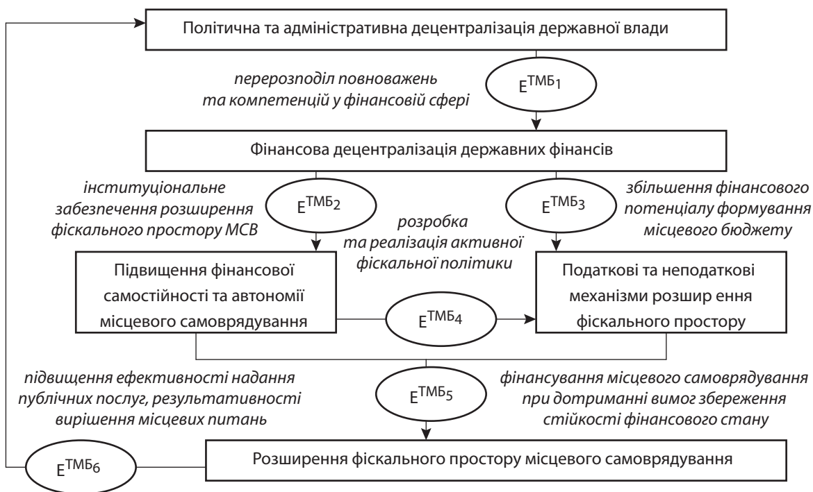
Рис. 2. Візуалізація авторської гіпотези формування теоретико-методологічного базису розширення фінансового простору місцевого самоврядування при здійсненні фінансової децентралізації

У рамках наведеного візуального представлення авторської гіпотези виділено такі основні елементи відповідного ТМБ, які характеризують ключові питання та протиріччя, що знаходять прояв у контексті здійснення процесу розширення фінансового простору та вирішення яких потребує наукового обґрунтування та практичного опрацювання: