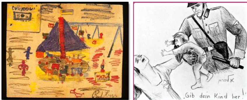
Фиг. 1. Рисунки на деца от гетото в Терезин

Детските творби повдигат за нас завесата на един свят, в който се отразява културата на времето. Свидетелства за детските рисунки са открити във Великия Новгород и датират от 1224 – 1238 г. Смята се, че принадлежат на необучени деца, които рисували, докато почи-вали след учебни занятия. Детски рисунки от Средновековието пред-ставят героизиран автопортрет на момчето Онфим (фиг. 2). На нея има надпис: „Аз като звяр“. Представява подобие на кон с конник, който пробожда с копие врага си, паднал на земята.