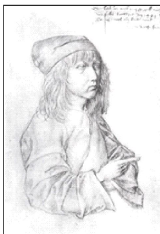
Фиг. 4. А. Дюрер. Автопортрет на 12 години

Художниците от XVII – XVIII в. откриват за себе си света на детството, изпълнен с психологическа и интелектуална дълбочина. Достатъчно е да си спомним портретите на инфанта Маргарита от Веласкес, на Титус от Рембранд, на децата на Рубенс, живота на семейството, разкрит в картините на малките холандци, образите на деца по време на интелектуални занимания и игри в творчеството на европейски художници от XVII – XVIII в. В творчеството на художниците от този период се отразяват проблемите, осмислени от френските просветители на XVIII в.