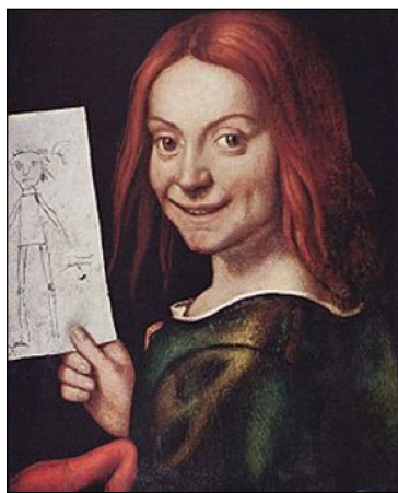
Фиг. 3. Дж. Карото. Дете с рисунка

От епохата на Възраждането са съхранени достоверни факти, свидетелстващи за поощряването на детското художествено творчество от най-ранна възраст. След Възраждането изкуството е оставило многочислени изображения на пеещи, музициращи, рисуващи и четящи изображения на деца. Това е епохата, когато се разширяват границите на детството и на детето е отредена нова роля в семейството, това е времето, когато педагогиката се обособява като наука. Например портрет на „Дете с рисунка“, творба на италианския художник Джовани Франческо Карото (1480 – 1546).