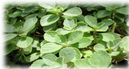
Figura 2. Planta de acetaminofen ( Plectranthus ornatus )

A continuación se muestran las vitroplantas de sanguinaria ( Justicia secunda (L.) y Orégano orejón ( Coleus blumei ) logradas a través de propagación in vitro .