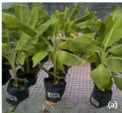
Figura 4. Morfología foliar de plantas de Musa AAA cv 'Pineo Gigante' regeneradas in vitro a partir de yemas irradiadas con tolerancia a sequía