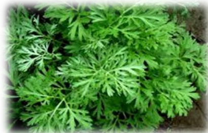
Figura 1. Planta de Ajenjo ( Artemisa absinthium )

En las Figuras 1,2 y 3 se observan las especies de plantas seleccionadas para ser propagadas in vitro en las zonas seleccionadas para la investigación.