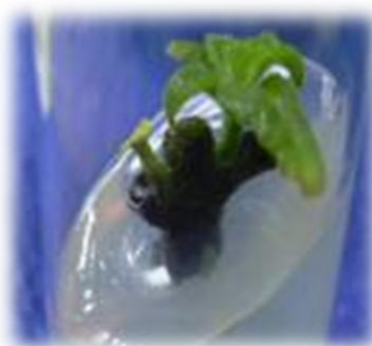
Figura 3. Brotes de Orégano orejón ( Coleus blumei ) obtenidos a través de cultivo in vitro de plantas

A continuación se muestran las vitroplantas de sanguinaria ( Justicia secunda (L.) y Orégano orejón ( Coleus blumei ) logradas a través de propagación in vitro .