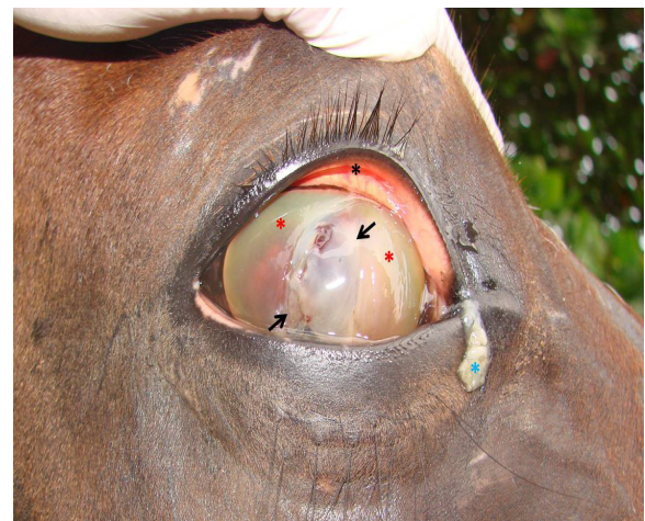
Figura 1. Úlcera corneal en un caballo. Observe la secreción purulenta en el canto medial (Asterisco azul), la conjuntivitis evidenciada por la coloración rojiza de la conjuntiva (Asterisco negro), el edema de la córnea (Asteriscos rojos), así como la solución de continuidad de la córnea (Flechas).

En la evaluación Clínica del animal, se encontró en el ojo derecho epifora con secreción purulenta, quemosis, conjuntivitis y edema con marcada lesión del epitelio corneal (Figura 1). Se realizaron pruebas especiales como el test de Schirmer, encontrándose aumento marcado en la secreción lagrimal; posteriormente se realizó la prueba de la Fluoresceína Sódica, evidenciando la marcada ulceración de la córnea (Figura 2). En el resto de sus sistemas presentaba normofuncionalidad.