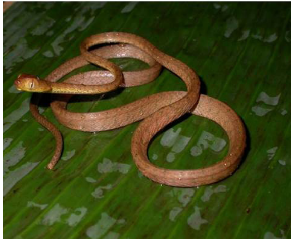
Figura 1. Especímen en vida de I. inornatus , colectado en el corregimiento de Pacurita, municipio de Quibdó. Chocó-Colombia (5.683, -76.66, 53 m).

de la especie para el departamento del Chocó. De igual forma, constituyen nuevos registros para el departamento de Santander-Colombia, sustentados por material museológico formales de la especie.