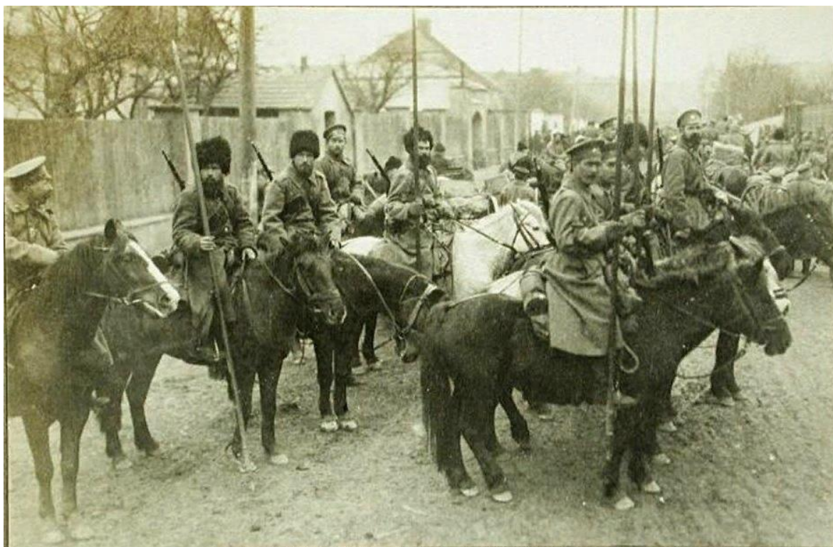
Рис. 4. Семиреченские казаки в походе (Фото времен Первой мировой войны)

В ходе Туркестанского восстания 1916 г. пострадало и казачье население Семиречья. В частности, в августе 1916 г. была полностью уничтожена станица Белоцарская, мужчины вырезаны, а женщины и дети уведены в плен, откуда вернулись немногие. Гибли военнослужащие казаки и в ходе подавления восстания. Всего в ходе восстания было убито и пропало без вести несколько сотен человек казачьего населения области (Ганин, 2016: 98).