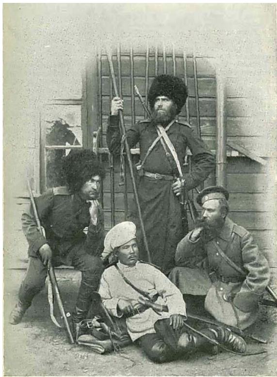
Рис. 2. Семиреченские казаки (Открытка конца XIX в.)

В конце 1870-х гг. активный период казачьей колонизации региона закончился. После 1880 г. темпы казачьей колонизации значительно сокращаются и до конца XIX в. остаются в целом невысокими. Казачье население в этот период увеличивалось фактически только за счет естественного прироста. Рассматривая географию казачьих поселений в Семиречье в конце XIX в., следует отметить, что распределены они в регионе были крайне неравномерно. Так, в Северной Киргизии казачьих поселений не было совсем. Станицы были сосредоточены в Верненском, Джаркентском и Копальском уездах, на важнейших коммуникациях, связывавших Сибирский и Туркестанский военные округа (Сапунов, 2001: 192).