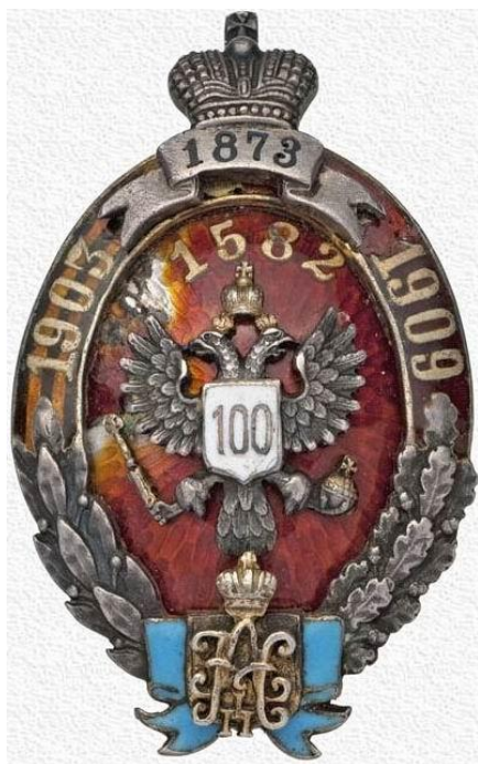
Рис. 1. Знак Семиреченского казачьего войска (для офицеров). 1912 г.

Следует отметить, что, несмотря на значительные усилия властей, в 1860–1890-е гг. в Семиречье переселилось достаточно мало казаков из Сибири. Хотя число новых станиц и выселков росло, это происходило за счет перераспределения собственно семиреченских казаков и за счет зачисления в казаки крестьянских переселенцев (Сапунов, 2001: 192).