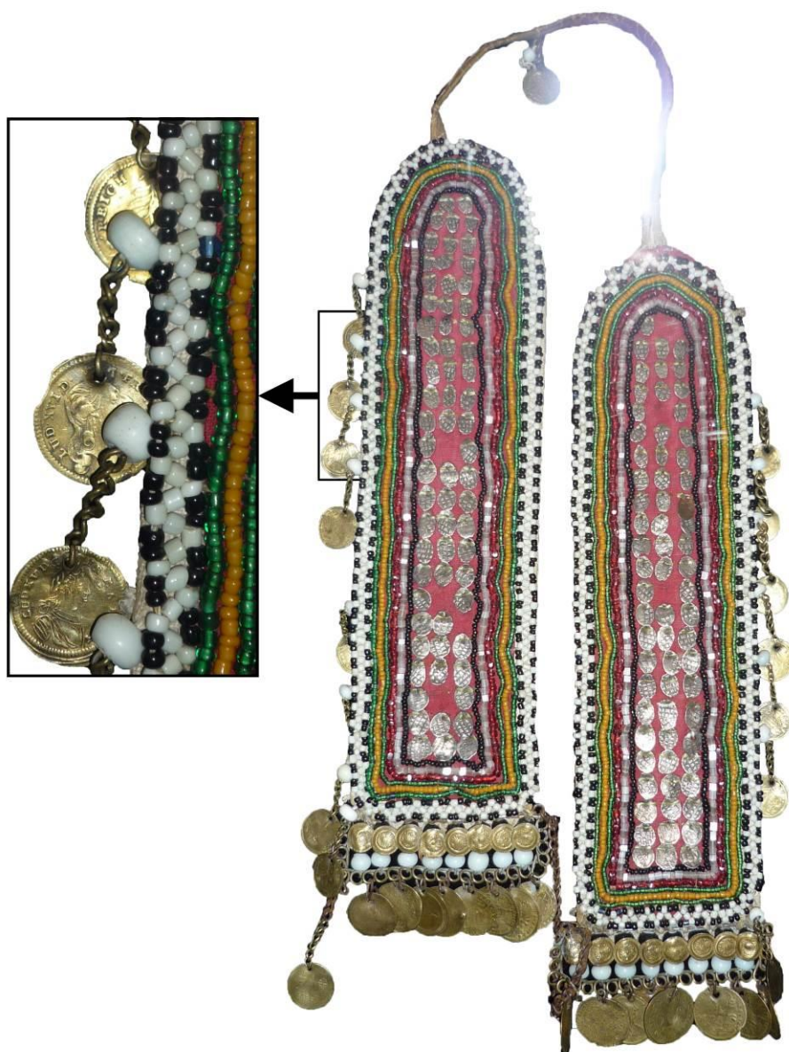
Рис. 3. Нагрудное украшение с нюрнбергскими жетонами (фрагмент). Мордва. Русский этнографический музей: Кол. № 2089–6.

До включения в состав Русского государства народы, проживающие на территории Поволжья, входили в состав Казанского ханства, однако после взятия Казани войсками Ивана Грозного в 1552 г. ситуация кардинально меняется. Достаточно быстро население Поволжья переходит под власть Русского государства. Условия вхождения для разных поволжских народов различались, но их объединяло включение в общий товарный рынок, который контролировался Москвой.