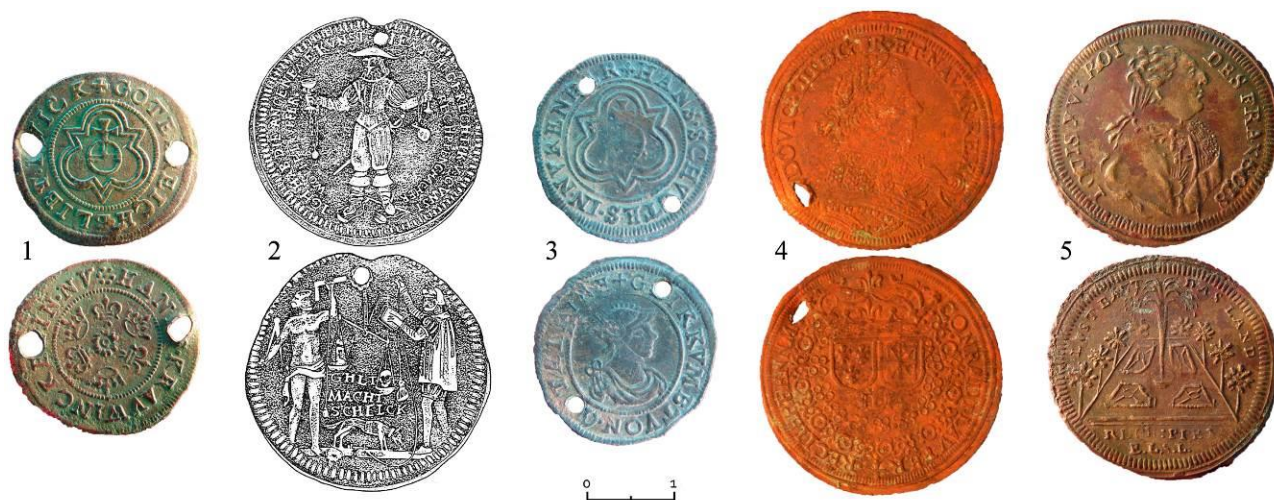
Рис. 4. Нюрнбергские жетоны с территории Западной Сибири. Мастера, чеканившие жетоны: 1 – Hans Krauwinkel; 2 – Wolf Lauffer II; 3 – Hans Schultes III; 4 – Conrad Lauffer; 5 – Ernst Ludwig Sigmund Lauer. Жетоны происходят из: 1 – кург. 4 погр. 43 Тискинского кург. мог.; 2 – кург. 13 погр. 2 Балагачевского кург. мог. (Яковлев, 2001: 103, рис. без №); 3 – кург. 33 Лукьяновского-1, кург. мог.; 4 – кург. 2 погр. 1 Елтыревского-2 кург. мог.; 5 – из погр. 22 Соровского кладб.

Наиболее популярными являлись жетоны мастера Hans Krauwinkel (1586–1635: их встречено 60 экз. (23,8 % от общего количества – 252 экз.). Жетоны этого мастера найдены в 15 памятниках. Жетоны других мастеров: Wolf Lauffer II (1612–1651) – 37 экз. (14,7 %) из 10 памятников; Hans Schultes III (1608–1612) – 28 экз. (11,1 %) из 4 памятников; Conrad Lauffer (1637–1668) – 23 экз. (9,1 %) из 8 памятников; Ernst Ludwig Sigmund Lauer (1783–1829) – 22 экз. (8,7 %) из 8 памятников; жетоны оставшихся 19 мастеров – от 1 до 13 экз. из 1–4 памятников (Рисунок 4).