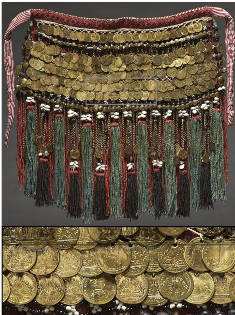
Рис. 2. Набедренное украшение Пулагай с нюрнбергскими жетонами. Мордва-эрзя. Изображение взято с официального сайта Русского этнографического музея: http://www.ethnomuseum.ru/nabedrennoe-ukrashenie-mordvy-pulagay-mordva-erzya (дата обращения: 05.04.2017)