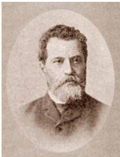
Рис. 1. Портрет Николая Васильевича Варадинова

Н.В. Варадинов оставил заметный след в истории развития российской юридической науки. Известен он также своей активной меценатской деятельностью, связями с видными представителями своего времени, в частности Н.И. Субботиным, Д.Н. Толстым, М.Н. Катковым, И.С. Гончаровым и многими другими. Несмотря на это, его личность в принципе осталась вне пределов сферы интересов ученых – историков, правоведов.