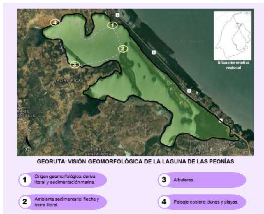
Figura 2. Paradas de la georuta didáctica por la Laguna de Las Peonías. Elaborado por los autores, 2017.

El diseño de la georuta didáctica está basado en la morfología costera que se exhibe en el paisaje de la Laguna de Las Peonías, escenario natural ubicado en entre los municipios Maracaibo y Mara del estado Zulia, Venezuela. La referida georuta intitulada “Visión geomorfológica de la Laguna de Las Peonías”, está conformada por cuatro (4) paradas a cumplir en un día de salida de campo con los estudiantes y/o público en general interesado en la geomorfología (figura 2). Cada parada del recorrido cuenta con título, ubicación en el área de estudio, objetivo, referentes teóricos a considerar y actividad de evaluación, además de mapas, tips informativos, cuadros explicativos, entre otros elementos que acompañan las explicaciones. La descripción de las paradas es la siguiente: