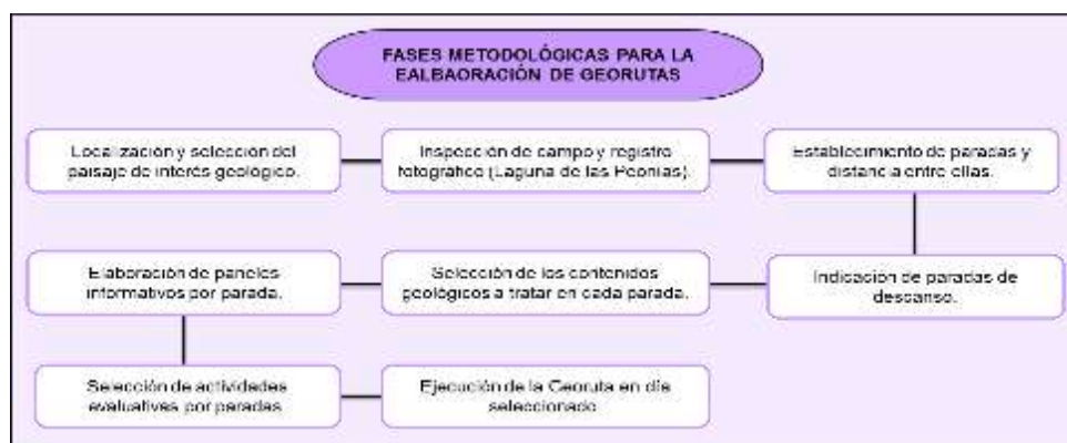
Figura 1. Fases metodológicas para la elaboración de georutas.

La recogida de la data para la investigación, se lleva a cabo en el escenario donde ocurre, es decir, en la U.E. Colegio Adventista “Sierra Maestra”, en cuya institución se observa la carencia de recursos basados en paisajes naturales. Por ésta razón, el diseño de la investigación es de campo. En los diseños de campo, los datos se recogen de manera directa en la realidad donde ocurren (Sabino, 1992). La no manipulación de los datos recabados, tipifica el presente estudio dentro del marco de un diseño no experimental. Así mismo, el diseño de campo guarda relación directa con la fase documental del estudio, por medio del cual se obtiene, mediante fuentes bibliográficas, los insumos metodológicos para la confección de la georuta didáctica por el paisaje de la Laguna de Las Peonías, para ello se toman los supuestos teóricos de Martín (2016), Martínez (2017) y Colange y Col. (2013) (figura 1).