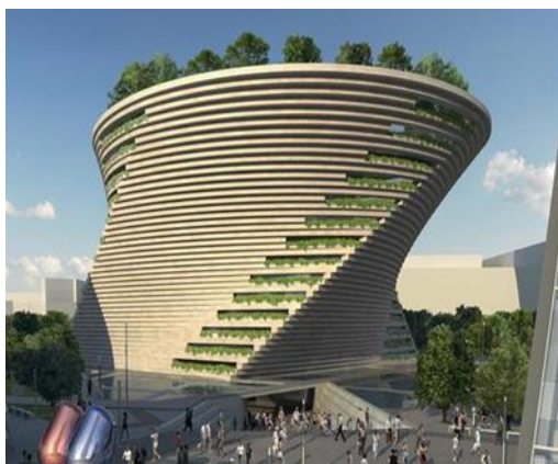
Рисунок 4 - Милан. Музей современного искусства «Reflections».

Еще большего контакта с космическим ощущением зритель сталкивается при рассмотрении другого проекта Д. Либескинда - жилой комплекс «Reflections» в Сингапуре (рис. 3). От взлета странных космических ракет, земля как бы вздрогнула, пошатнулась, а взметнувшиеся вертикали очертили метафору