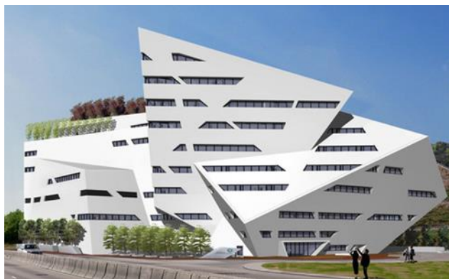
Рисунок 6 - Гонконг. Creative Media Centre. Д. Либескинд.