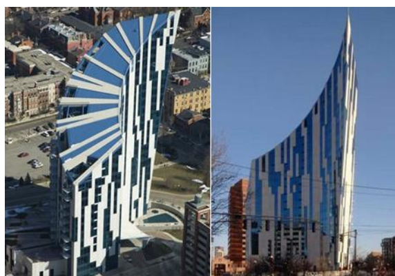
Рисунок 5 - Ковингтон. Комплекс «Ascent».

вертикальная разнонаправленность переплетена с веерообразным чувством полета. В эффектном скалообразном здании Креативного Медиа-центра в Гонконге (рис. 6) более ясно выражаются прямые супрематические ассоциации, однако архитектурно-тектонические образы скорее плакатны, чем в вышеназванных других работах автора. Здесь архитектурная форма не вышла из очарования и плена абстрактного искусства. Хотя горизонтальная направленность в формах оригинально влетена в наклонные плоскости, вместе с тем кажется, что супрематическая идея о космической направленности остается сумбурной [9, с. 78-84].