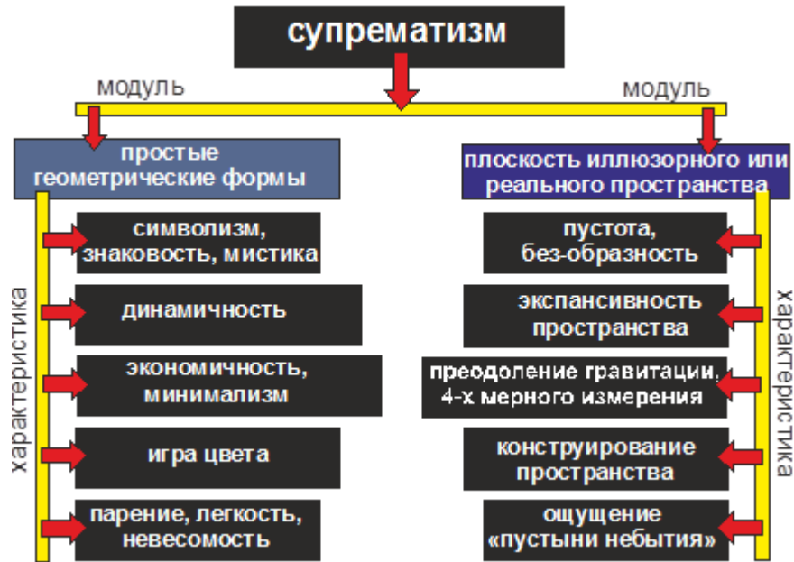
Рисунок 1 - Основные черты, характеризующие супрематизм.

Известный историк авангардной архитектуры Селим Омарович Хан-Магомедов в своем фундаментальном труде «Архитектура