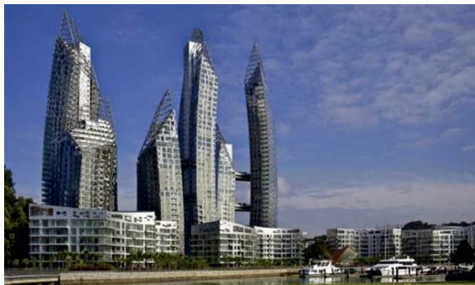
Рисунок 3 - Сингапур. Жилой комплекс.

мажорной ноты. Архитектура музея запоминается надолго благодаря супрематическому эффекту, когда архитектурная форма полностью «отрывается» от своей строительной субстанции. В музее художественно-образные ассоциации с архитектурной формой слитны и пластичны, как динамическая скульптура. Музей господствует в окружающей среде города, как некий единственный художественный шедевр-картина в провинциальном музее искусств. Метафора взрыва здесь настолько отдалена от физического взрыва, что не отталкивает, не ужасает страшностью, а наоборот вызывает психоэстетическое любопытство, так и хочется обойти это здание, находясь в «космическом полете», благоговей перед чувством парения над землей. Чисто художественная визуальная идея супрематизма воплощена языком архитектоники [9, с. 78].