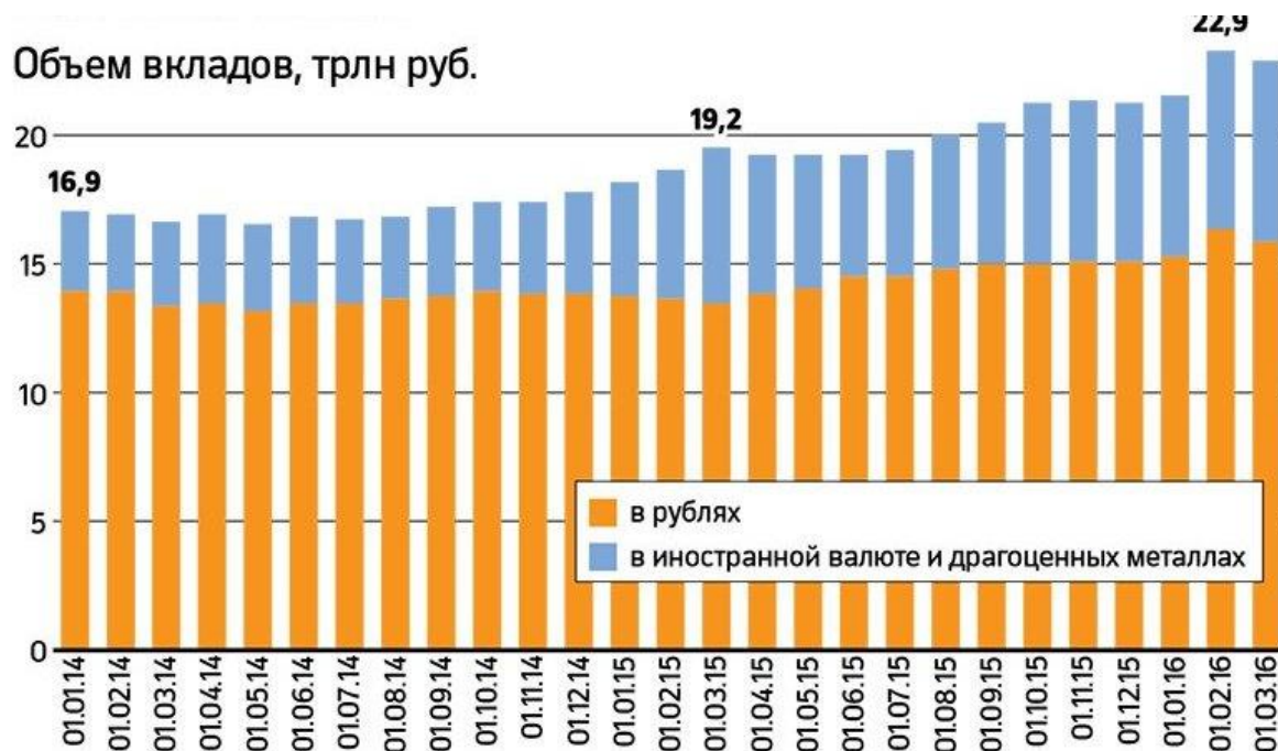
Рисунок 1 - Тенденция объемов средств населения на банковских счетах

Исходя из данных отображенных на рис. 1, можно сделать вывод, что по объему средств на счетах в кредитных институтах, наиболее предпочтительным вариантом для населения является вложения средств в рублях. На начало 2014 года вклады (депозиты) в рублях составляли 14,8 трлн. руб., а доля средств в иностранной валюте составила 2,1 трлн. руб., что в общем объеме средств равнялось 16,9 трлн. руб. На март 2015 года депозитная база в рублях составила 14,5 трлн. руб., но прирост в иностранной валюте был выше чем на начало 2014 года, и составил 4,7 трлн. руб., в общем объеме 19,2 трлн. руб. [4, с. 45]