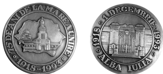
6. Medalia comemorativă 75 de ani de la Marea Unire 1918-1993 1 decembrie Alba Iulia .