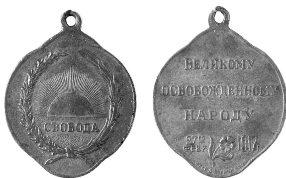
2. Medalia cu toartă Svoboda. Velikomu osvoboжденomu narodu 27 фев. 1917 (Libertate. Marelui popor eliberat 27 februarie 1917).

Muzeul Național de Istorie a Moldovei deține o colecție de medalii și jetoane din această perioadă. Ele sunt dedicate spiritului revoluționar care domina societatea rusă. Pe majoritatea din ele este reprezentată o femeie cu un drapel în mână, simbolizând Rusia eliberată. Ideea libertății și egalității străbate ca un fir roșu pe toate imaginile acestor piese. Pe unele din ele erau reprezentate portretele unor personalități politice și ale unor scriitori cu viziuni progresiste: A. Kerenski, Breșko-Breșkovskaia, Tolstoi ș.a. Toate jetoanele sunt însoțite de lozinci revoluționare sau citate din poezii revoluționare.