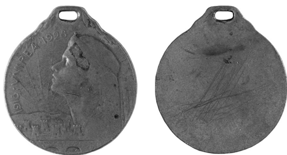
4. Medalia comemorativă unifacies, cu toartă Unirea 1918-1928 .