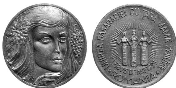
5. Medalia comemorativă 75 de ani de la Unirea Basarabiei cu Țara Mamă, România 1918-1993 .