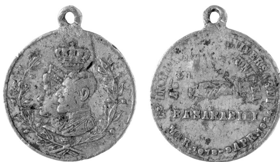
3. Medalia comemorativă cu toartă Șase ani de la Unirea Basarabiei 27 martie 1918 - 9 aprilie 1924 .

Domnia Regelui Ferdinand I a fost marcată de două evenimente majore din istoria țării: Primul Război Mondial și Marea Unire. Ferdinand s-a încoronat în 1922 ca primul Rege al României Mari. Personalităților Regelui Ferdinand și Reginei Maria le-au fost consacrate numeroase creații meda-