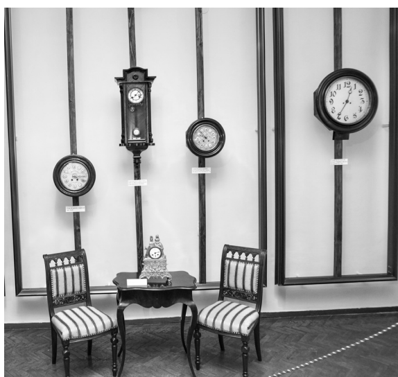
2. Expoziția „Ceasul de-a lungul timpului” (detaliu).