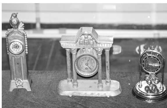
3. Expoziția „Ceasul de-a lungul timpului” (detaliu).

Un loc aparte în spațiul expozițional îl ocupă ceasul de birou și de șemineu, ceasul de călătorie, ceasul deșteptător. Pe lângă desenul plăcut, acestea, fiind și portative, erau însoțitoare fidele ale omului, care pe lângă „trezirea de dimineață” sau „plimbările cu trăsura”, ele rămân niște păstrătoare a poveștilor spuse la gura unui șemineu și un îndemn la reevaluarea semnificației timpului – prieten sau rival, dar parte a existenței noastre.