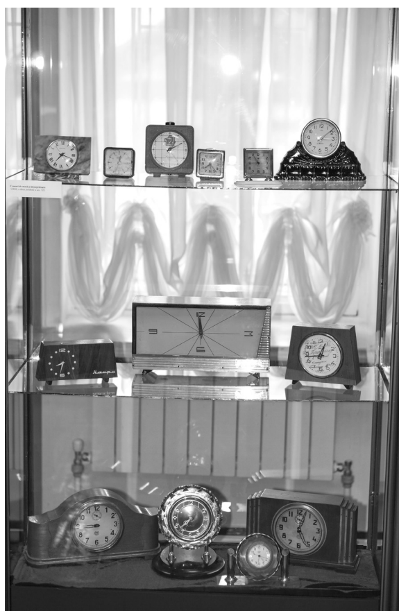
4. Expoziția „Ceasul de-a lungul timpului” (detaliu).