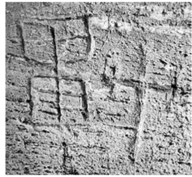
Рис. 7. Латинский крест и другие знаки.

настенные изображения, отмеченные И. Кедриним на стенах кельи (прил. 4), а В.Ф. Розановым и в ней, и в церкви: «на стенах их иссечены кресты старинной формы, четвероконечные и шестиконечные, с подножиями» (прил. 3).