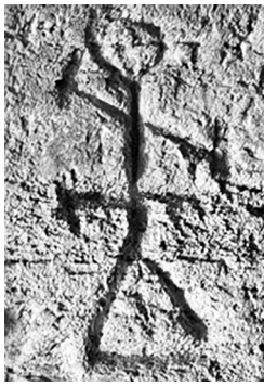
Рис. 5. Шестиконечный крест.