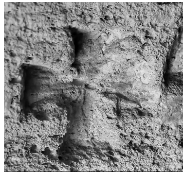
Рис. 6. Лапчатый крест.