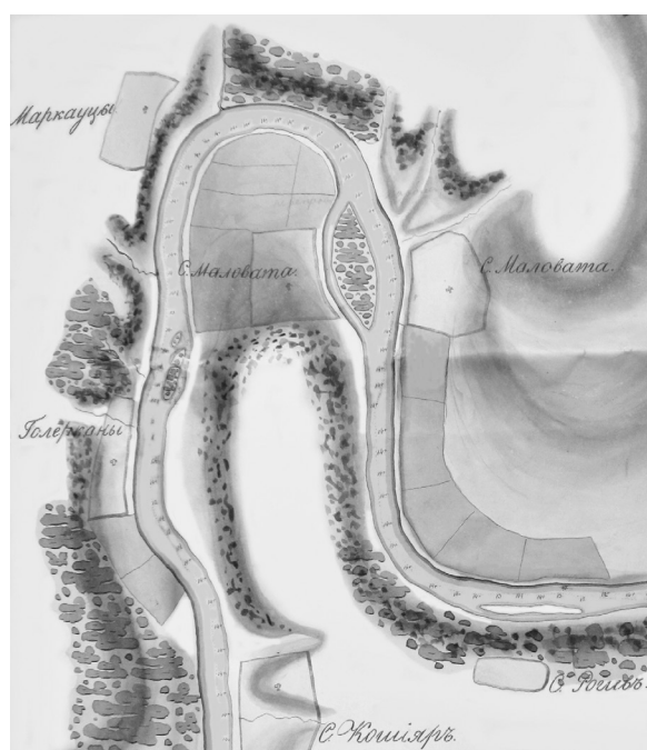
Рис. 2. «Гидрографическая карта реки Днестра» Б.Я. Эйхнера и др. (1840 г., фрагмент).

Вскоре с. Роги посетил архиепископ Гавриил (в миру историк В.Ф. Розанов). Точная дата его поездки на Днестр неизвестна, вероятнее всего, она состоялась в середине 1840-х гг. По понятным причинам записки этого автора самые профессиональные из всех известных и любопытны тем, что часть текста посвящена жителям с. Роги (прил. 3).