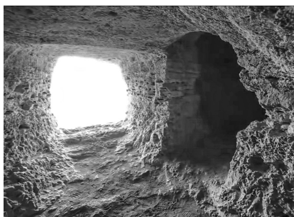
Рис. 4. Симеоновский пещерный монастырь. Окно церкви (вид изнутри).

В них речь идет о двух искусственных пещерах (по И. Кедрину – гротах), первая из которых (по дороге из с. Роги), судя по всему, служила кельей 5 . В ней был вход с тремя ступенями через арочную дверь шириной 1,07 м, высотой 1,8 м. Его внутренняя часть имела размеры 5,3 6 ×2,1 м, при высоте до 2,0 м. Вторая пещера, длиной до 15 м и шириной 4,3 м, состояла из трех частей: трапезной, собственно церкви и алтаря. И. Кедрин сообщает, что из алтаря можно было «подняться на небольшую площадку, в одной из стен которой находится дверь в крошечную комнату длиной и шириной в 1½ [1,07 м] аршина, которая, быть может, служила ризницей обителя, между тем как в другой стенке площадки находится круглое окно» (рис. 4). По его же данным, вода, просачивающаяся из стен и из свода «большого грота», сильно разрушила помещение церкви и особенно вход в нее, который в настоящее время превратился в длинную низкую и косую щель.