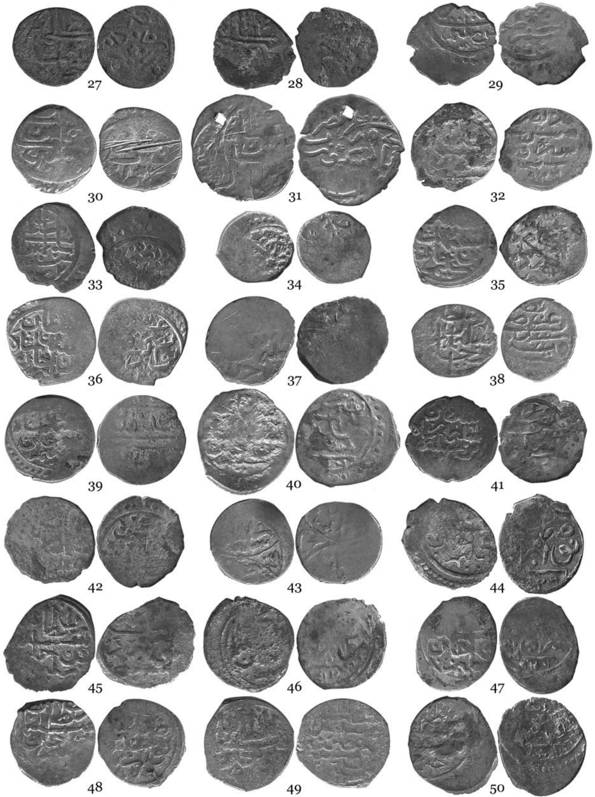
Рис. 2. Монеты из состава комплекса из краеведческого музея г. Вилково.