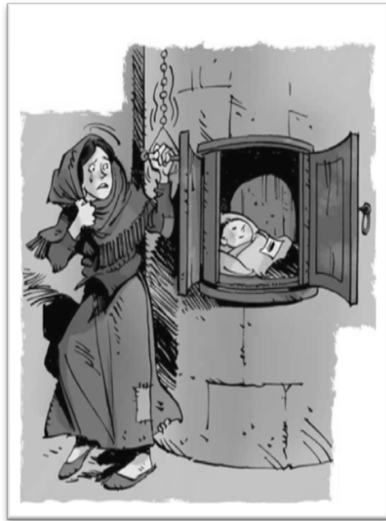
Figura 2: O ato velado da entrega na “roleta” Fonte: Charge colhida no Google 4

A humanização, revestida pela caridade como forma de solidariedade aos menos assistidos, começou a tomar força no âmbito da igreja católica, através das denominadas ‘Casas de Misericórdia’, que recebiam apoio econômico da esfera pública, bem como privada. Parece que, com a chegada da idade da razão (7 anos), as crianças eram transferidas para internatos, tanto de meninas quanto de meninos, sob a direção de freiras e de padres respectivamente. Não obstante, como já discutido por SILVA,