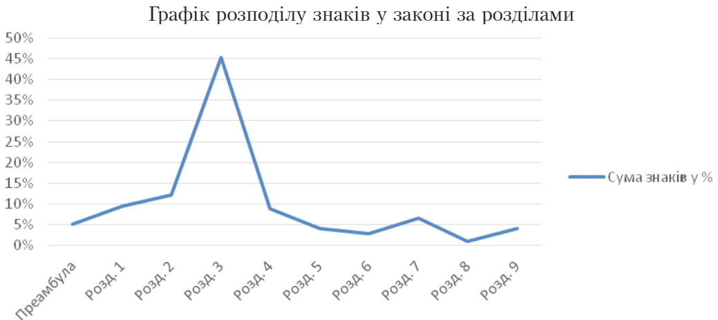
Рис. 2. Розподіл текстового матеріалу ЗУ «Про охорону атмосферного повітря»

За допомогою цих коефіцієнтів можна дослідити характер коливань та розташування найбільшої кількості законодавчого матеріалу. Таким дослідженням передували розрахунки кількості знаків у кожному з розділів цих законодавчих актів, на підставі яких проводилися перерахунки у відносні величини (%). Як приклад, приведено такі дані стосовно ЗУ «Про охорону атмосферного повітря» (рис. 2).