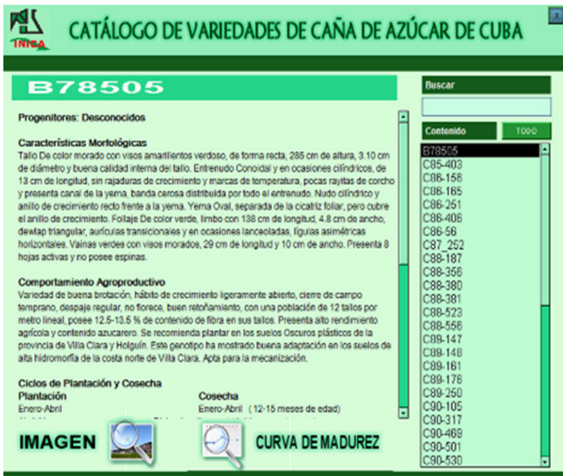
Figura. 2 - Interfaz de usuario características de una variedad