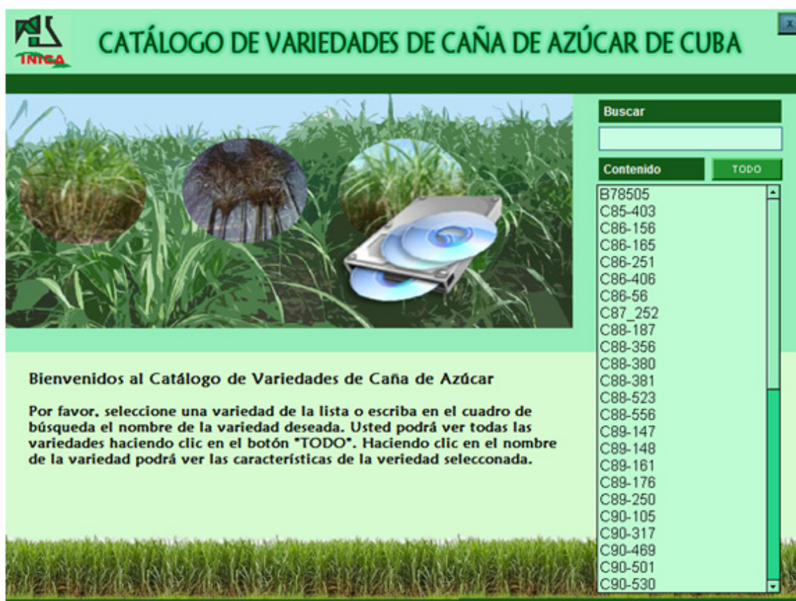
Figura. 1 - Interfaz principal de usuario

La multimedia no requiere de instalación y puede ser ejecutada desde un CD-R o desde una unidad flash (USB). Para su ejecución se debe disponer de una computadora personal con el sistema operativo Windows 98 o superior, un microprocesador Pentium II a 200 MHz, 64 MB de memoria RAM, unidad lectora de CD o puerto USB, mouse y tarjetas para el soporte multimedia (audio y vídeo).