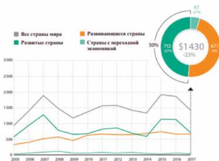
Fig. 1. FDI inflows in 2005–2016 and projections for 2017–2018 ($ billion and percents)