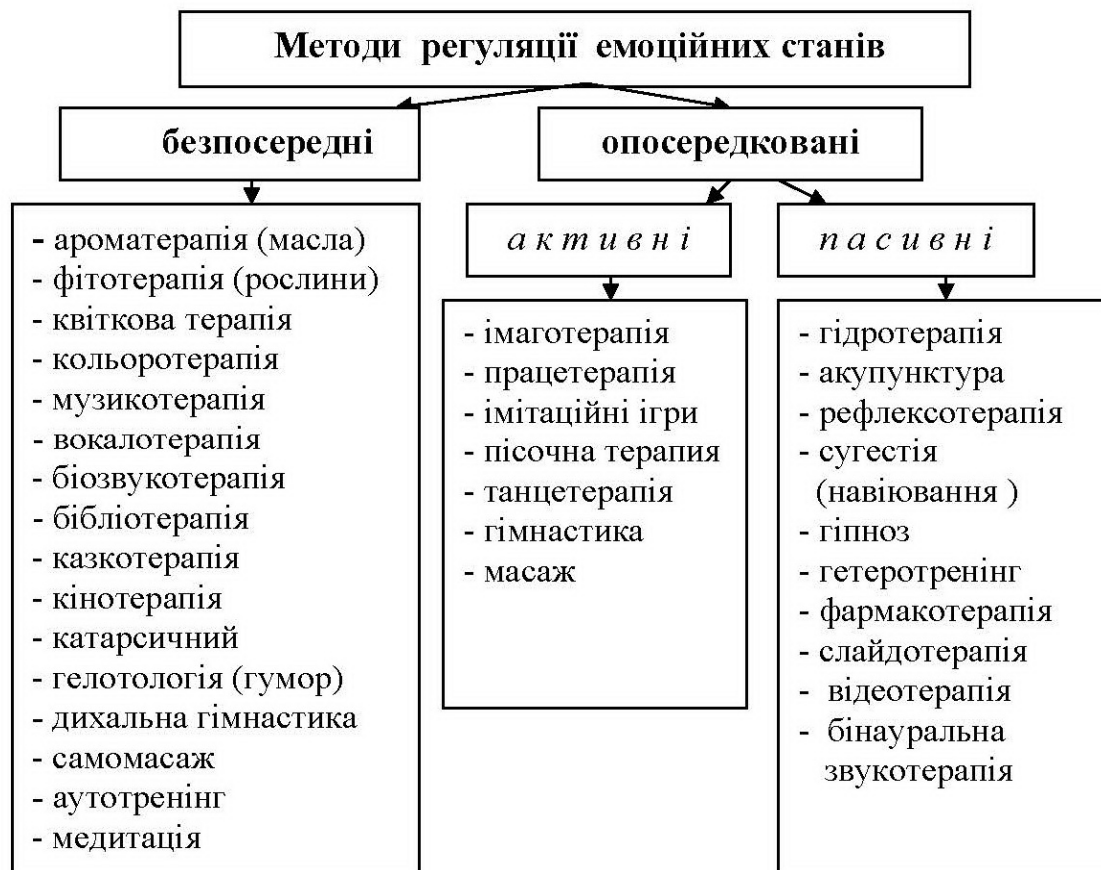
Рис. 1. Розподіл методів регуляції емоційної сфери у психотерапії

методів регуляції, у зв'язку із застосуванням зовнішніх предметів фізичного середовища, опосередковані методи в нашому дослідженні розподіляються на активні і пасивні.