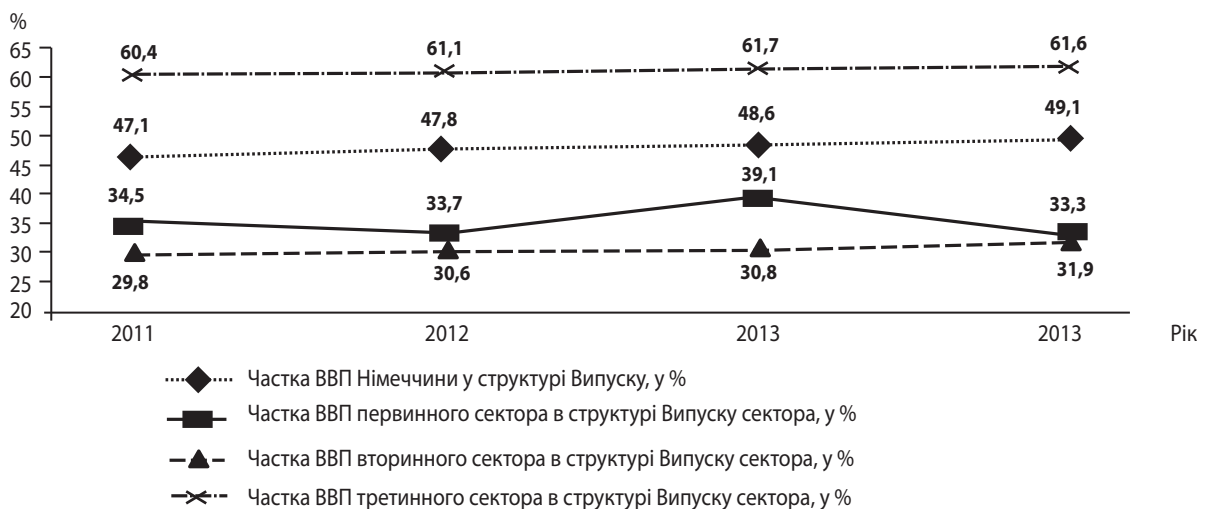
Рис. 2. Частка ВВП у структурі випуску, Німеччина, випуск = 100 %

Макроекономічна модель «витрати-випуск» тісно пов'язана із відповідною моделлю мікрорівня – аналізом беззбитковості [23, с. 271–307], що охоплює дві стадії економічного процесу – виробництво й утворення доходу – і дає можливість забезпечувати макроекономічну стабільність шляхом безперешкодного розвитку підприємництва на мі-