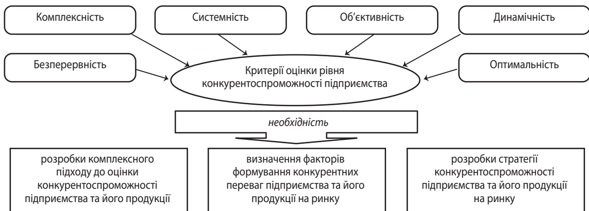
Рис. 3. Критерії оцінки рівня конкурентоспроможності підприємства

Оцінка конкурентоспроможності підприємства має враховувати критерії її проведення. Критерії оцінки рівня конкурентоспроможності підприємства зображено на рис. 3.