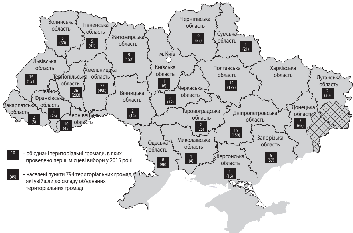
Рис. 1. Об'єднані територіальні громади, в яких проведені перші вибори у 2015 р. [5; 7]

За статистичними даними площа території 159 новостворених громад становить 35,8 тис. кв. км, або 6,2 % від площі території областей України, які мають ОТГ. Станом на 01.01.2016 р. у громадах проживає 1,4 млн осіб, або