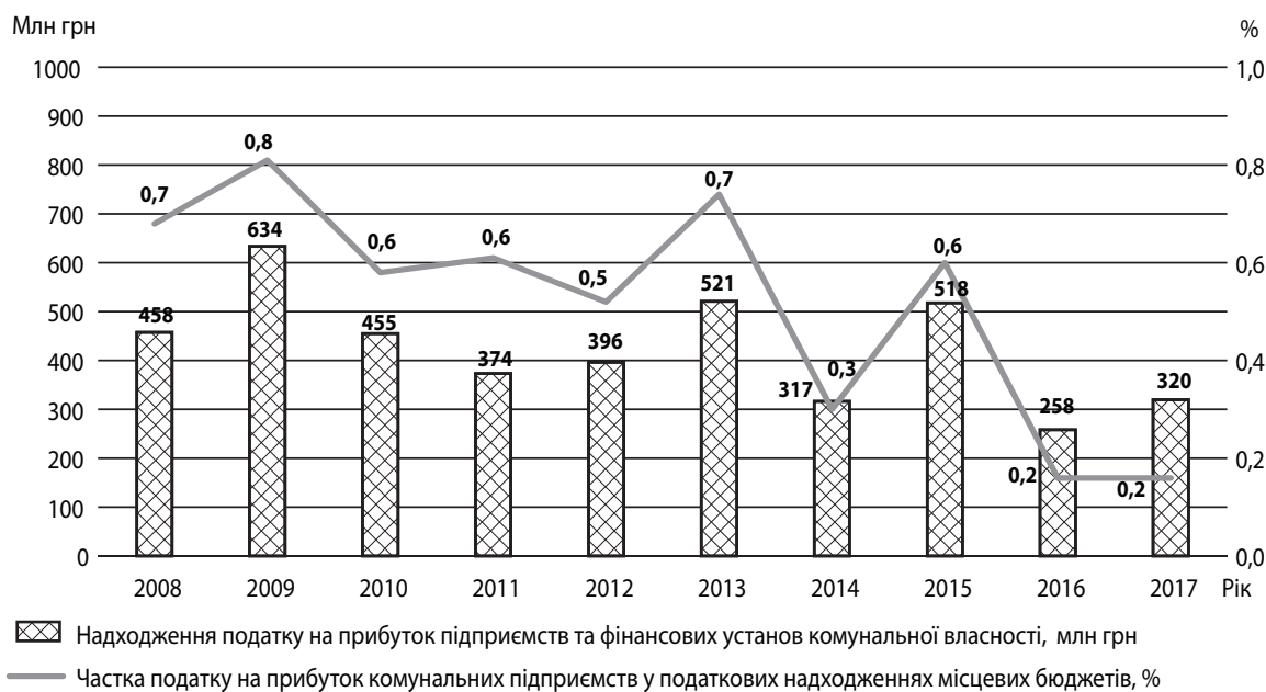
Рис. 4. Динаміка надходжень податку на прибуток підприємств і фінансових установ комунальної власності в Україні у 2008–2017 роках