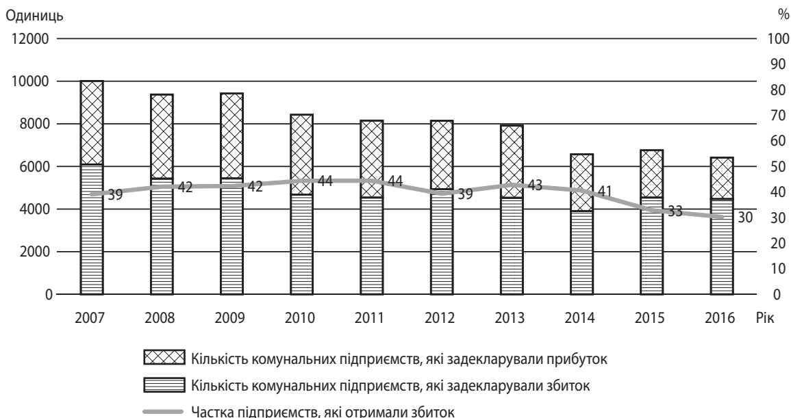
Рис. 3. Динаміка кількості комунальних унітарних підприємств, які задекларували збиток і прибуток, по Україні в цілому у 2007–2016 рр.

За 2014–2016 рр. дані без урахування тимчасово окупованої території АРК та частини зони проведення АТО. За 2017 р. офіційні дані будуть оприлюднені лише в жовтні 2018 р.