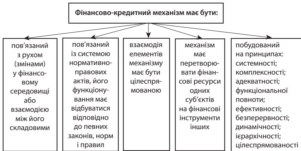
Рис. 1. Специфічні риси, методологічні засади та умови формування фінансово-кредитного механізму