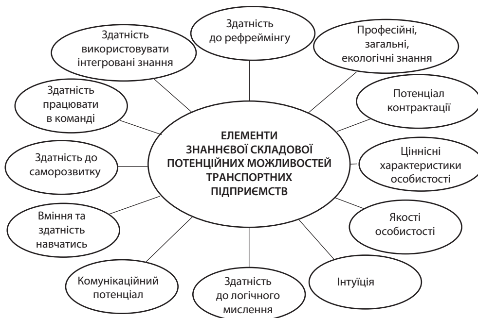
Рис. 1. Елементи знанневої складової потенційних можливостей транспортних підприємств

4. Europe 2020 strategy. URL: https://ec.europa.eu/info/european-semester/framework/europe-2020-strategy_en